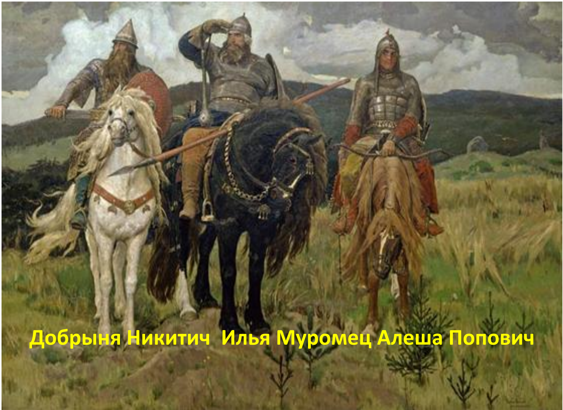
Добрыня Никитич Илья Муромец Алеша Попович