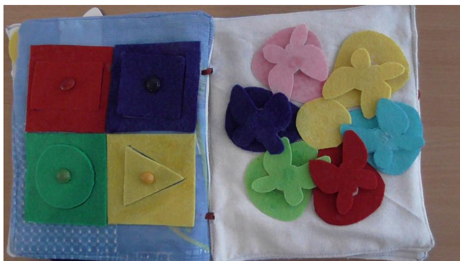
«Играя развиваем моторику»